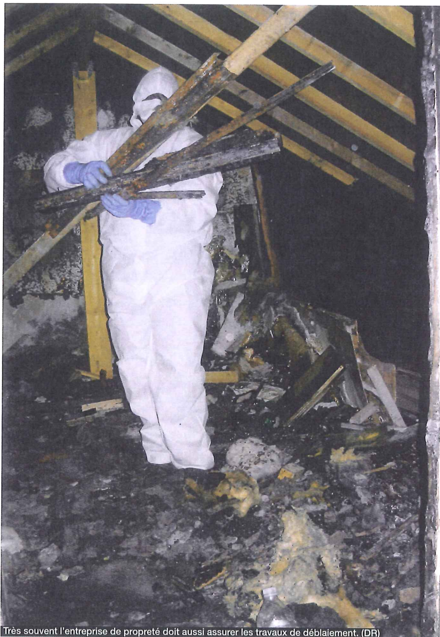
Très souvent l'entreprise de propreté doit aussi assurer les travaux de déblaiement.